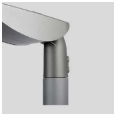
Adecuado para montaje superior o lateral Ø60. Ángulo de inclinación ajustable +15°.