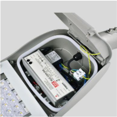
Caja de protección eléctrica IP66