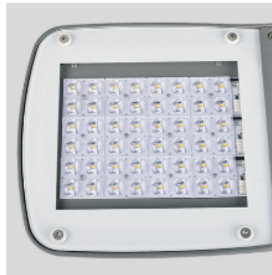
Cristal templado IK08. Adecuado para placas de circuito impreso Zhaga estándar