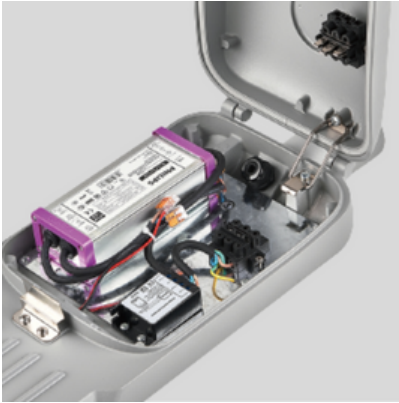
Caja de protección eléctrica IP66. Corte automático de la alimentación al cuando se abre la tapa.