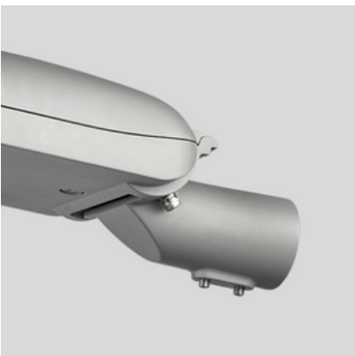
Adecuado para montaje superior o lateral Ø60 y Ø48mm opcional. Ángulo de inclinación ajustable -10° +10°.