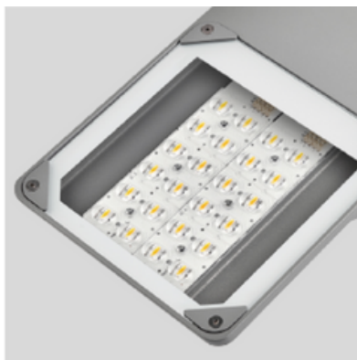
Cristal templado IK09. Apto para estándar Zhaga estándar.