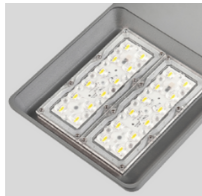
Posibilidad de integrar Módulos Retrofit con lentes IP66