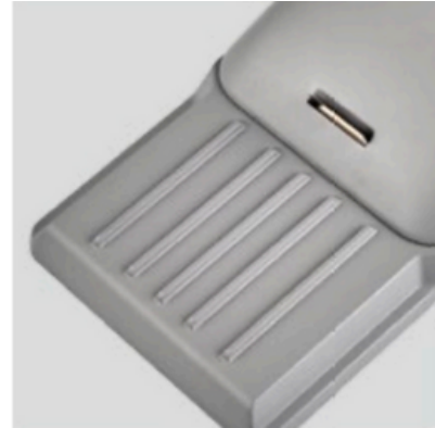
Aletas integradas para una mejor disipación del calor