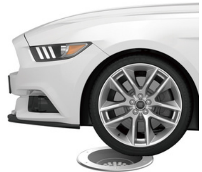
Résistance à la charge statique (5000 Kg)