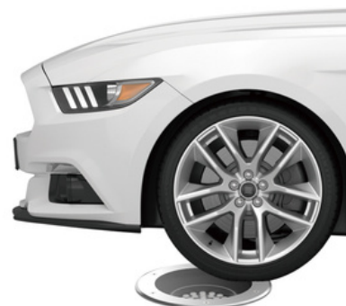
Resistencia a la carga estática (5000 Kg)