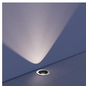
Aplicación de bañadores de pared